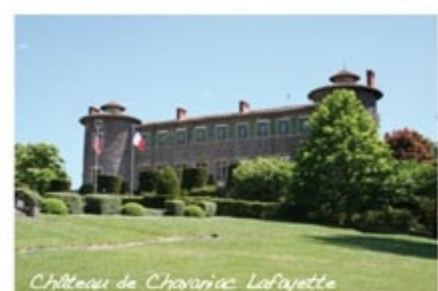
Château de Chavaniac-Lafayette

de la montée, prendre le premier chemin à droite. Passer dans le lotissement et monter entre les prés. Rejoindre une piste plus large au niveau d'un bâtiment de ferme. Continuer en face. A la fourche, prendre à droite jusqu'au Jarrisson. Traverser le hameau, au croisement, monter la route à droite, puis emprunter le premier chemin à gauche dans les prés. Traverser le ru et monter vers Navat (maison d'assemblée, fontaine). Monter le chemin entre les maisons pour rejoindre la D 590 que l'on suit à gauche sur 100 m. Prendre la première route à droite