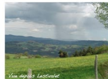
Vue depuis Lestivalet

le chemin à droite pour rejoindre Chavaniac-Lafayette (Château, conservatoire botanique). Emprunter la D 513 à gauche, à la sortie du village, suivre la piste à droite. Traverser Soulagès. A la sortie du bourg, prendre la route à gauche qui franchit le ruisseau et monter le chemin à gauche. A la fourche suivre le chemin à droite. Délaissier un croisement puis un chemin à gauche et une large piste à droite. La piste continue à droite et rejoint la N 102. Traverser celle-ci en face à travers un grand parking, passer la voie ferrée et rejoignez la Morge par la route. Passer le village et monter le chemin en face entre les maisons jusqu'à Rassac. Suivre la route à gauche sur 100 m et emprunter le 1 er chemin sur la droite. Prendre la D 115 à gauche puis à droite jusqu'à Preyssat. A l'entrée du hameau, bifurquer sur un chemin herbeux à droite. Rejoindre une piste et la descendre à gauche jusqu'à Nozeyrolles. Tourner à gauche et descendre la route jusqu'à la D 168 que l'on suit à gauche. 500 m après, prendre la piste à droite pour rejoindre la D 590, prendre le monotrace tout de suite après l'aire de pique-nique et rejoindre Langéac.