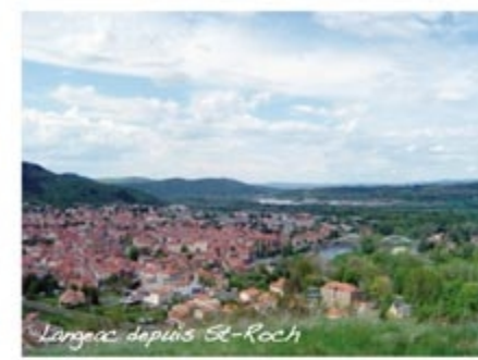
Langéac depuis St-Roch

sur un chemin pierreux. A la route prendre à gauche puis à droite sur une belle piste. Traverser la Nationale par le boviduc pour rejoindre Freycenet. Au fond du village, prendre le chemin qui file en contrebas sur la gauche, traverser le ruisseau et prendre à gauche le premier chemin qui remonte et devient sentier entre les prés. A la route, prendre à gauche jusqu'à Rouvenet puis